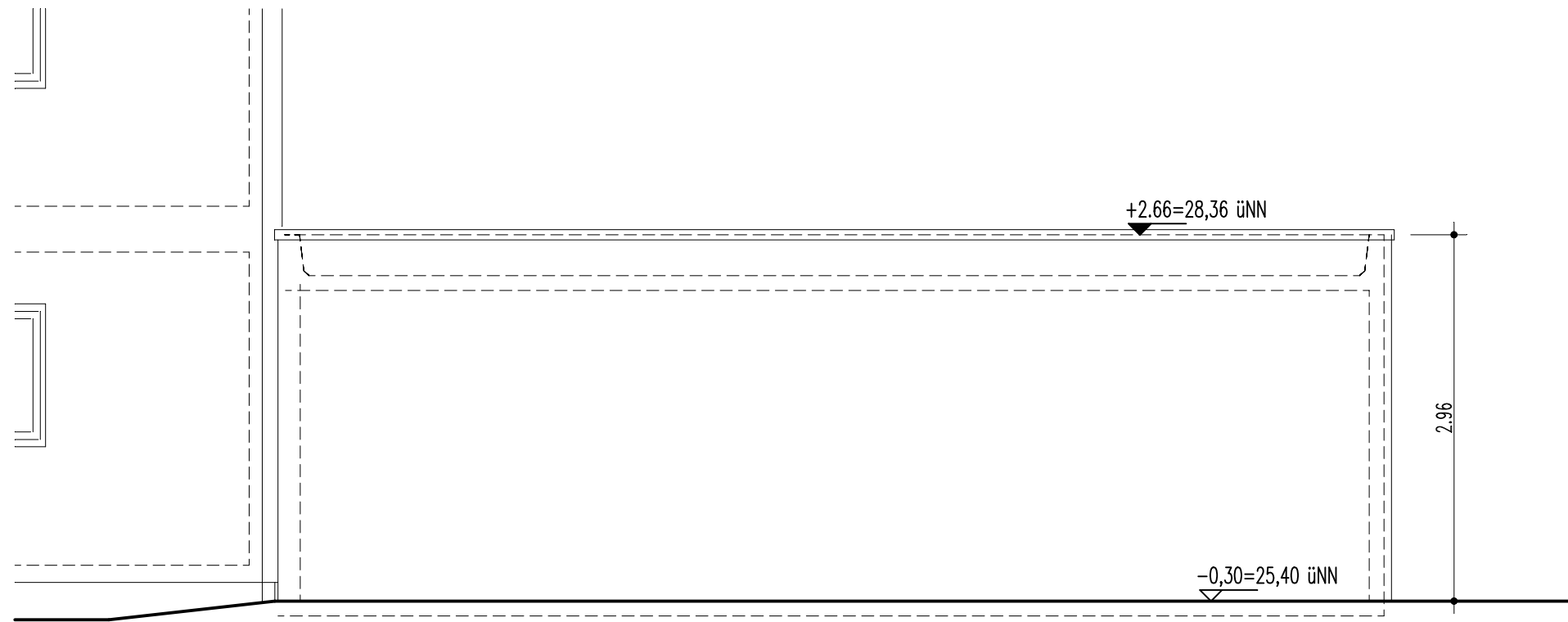
ANSICHT OST – AN DER GRUNDSTÜCKSGRENZE